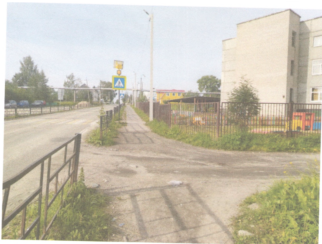
Тротуар –улица Садовая